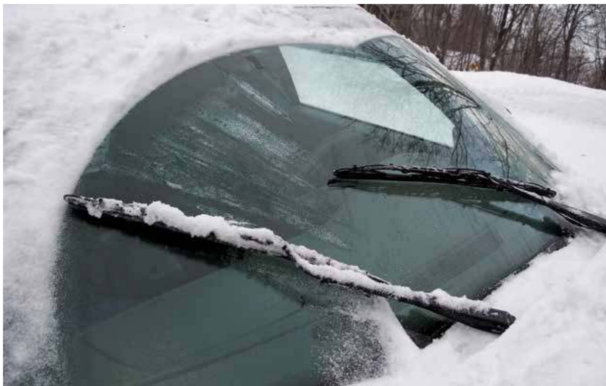
«Everblades» pusserblad til høyre og standard pusserblad til venstre på bildet.